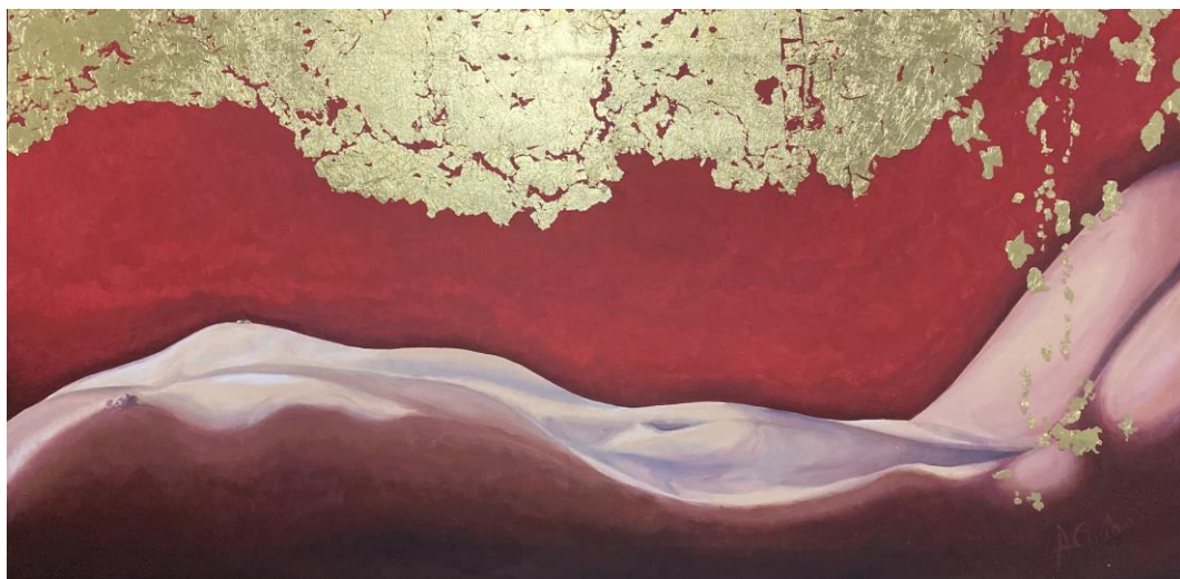
Terra 100x50 cm Acrilico su tela

Insegnante di Discipline Grafiche e Pittoriche presso il Liceo Artistico "A. Vittoria" di Trento dal 2007 ad oggi, cerca di trasmettere tutta la sua passione per il disegno e la pittura ai suoi studenti. Ha al suo attivo la partecipazione a diverse collettive e manifestazioni artistiche e partecipa alla 4 a Bial de Arte Barcelona presso il MEAM - Museu Europeu d'Art Modern.