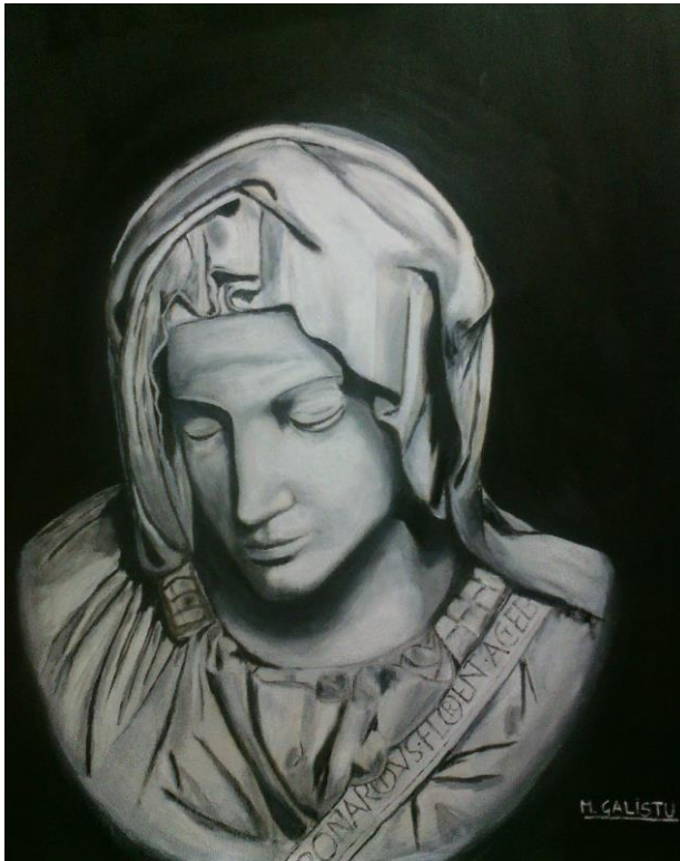
La Pietà di Michelangelo

Sassari 28 maggio 1972. Geometra professionista di Sassari e Pittore autodidatta, con la passione per i colori ad olio. «La mia formazione artistica nasce dal mio amore per i colori e dalla voglia di imparare sempre tutto da solo. Ho partecipato a varie estemporanee di pittura in giro per la Sardegna, confrontandomi con i grandi maestri Sardi e grazie ad un'associazione artistica, di cui sono stato membro, ho esposto in vari locali sardi, tra cui il Faber di Tempio Pausania (sala espositiva Tempiese dedicata a Fabrizio De Andrè) e lo storico Caffè Tettamanzi di Nuoro (frequentato in passato da grandi personaggi della letteratura sarda, tra cui Grazia Deledda). In tale occasione la Nuova Sardegna mi ha dedicato un articolo».