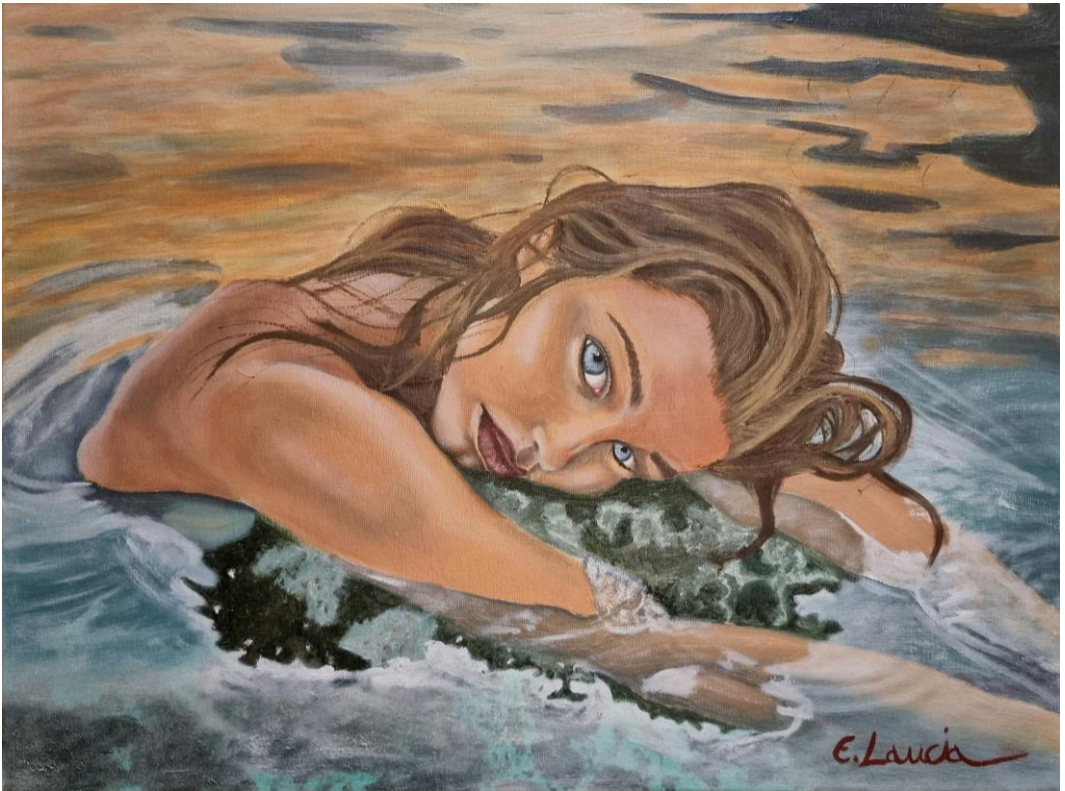
Ragazza al tramonto

Nasce a Caserta l'8 giugno 1997 ma originario di un piccolo comune in provincia di Benevento. Proveniente da diverse generazioni di artisti, sin da piccolo si dilettava nel disegno, una passione che negli anni non ha mai approfondito, finché, all'età di 24 anni, nelle lunghe giornate segregato in casa, a causa del Corona Virus, inizia a ritrarre dei soggetti a matita ma, dopo vari disegni, decide di cimentarsi nella pittura ad olio, per sperimentare nuovi orizzonti. Inizia così a dipingere, da autodidatta, volti di bellissime donne, tanto che nel luglio del 2022 decide di organizzare una mostra intitolata: "SGUARDI traVOLT", a San Lorenzo Maggiore (BN), suo paese d'origine, restando molto soddisfatto delle impressioni che i quadri destavano al suo pubblico. Sensazioni che lo hanno spronato a proseguire ed a migliorarsi sempre di più.