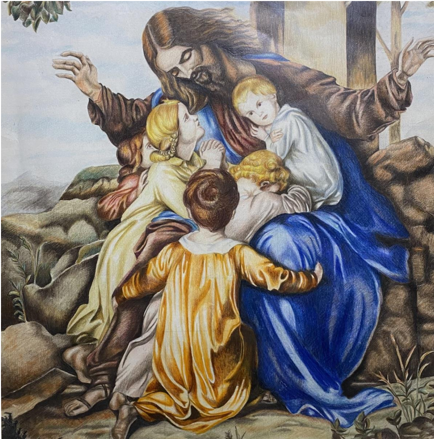
Lasciate che i bambini vengano a me