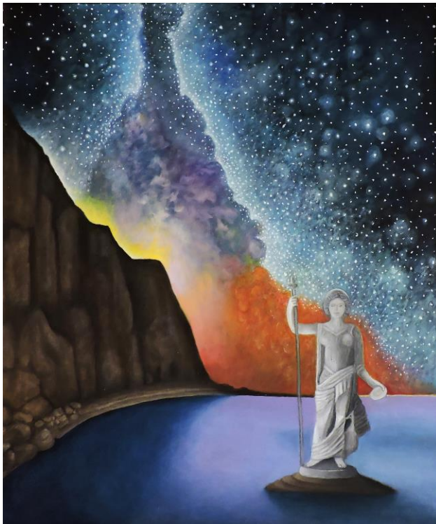
Era Allegoria nascita Via Lattea

«Sono nato a Roma nel 1968, da sempre appassionato d'arte, ho seguito il corso di pittura triennale dell'Accademia Urbana delle arti del Maestro Rodolfo Papa. La mia pittura nasce dalla necessità di evadere dal mondo e dalla vita quotidiana. Considero la pittura una medicina per l'anima. Per me l'arte è meraviglia, continua scoperta di forme e colori. Nella mia pittura la magia, il soprannaturale, l'inesplicabile incontra la realtà, in un'inevitabile fusione dei due mondi. I miei quadri sono firmati, sul retro, con pseudonimo di Tito. La prima e la terza lettera dello pseudonimo richiamano non casualmente un iconico simbolo della cultura giapponese, i portali Torii».