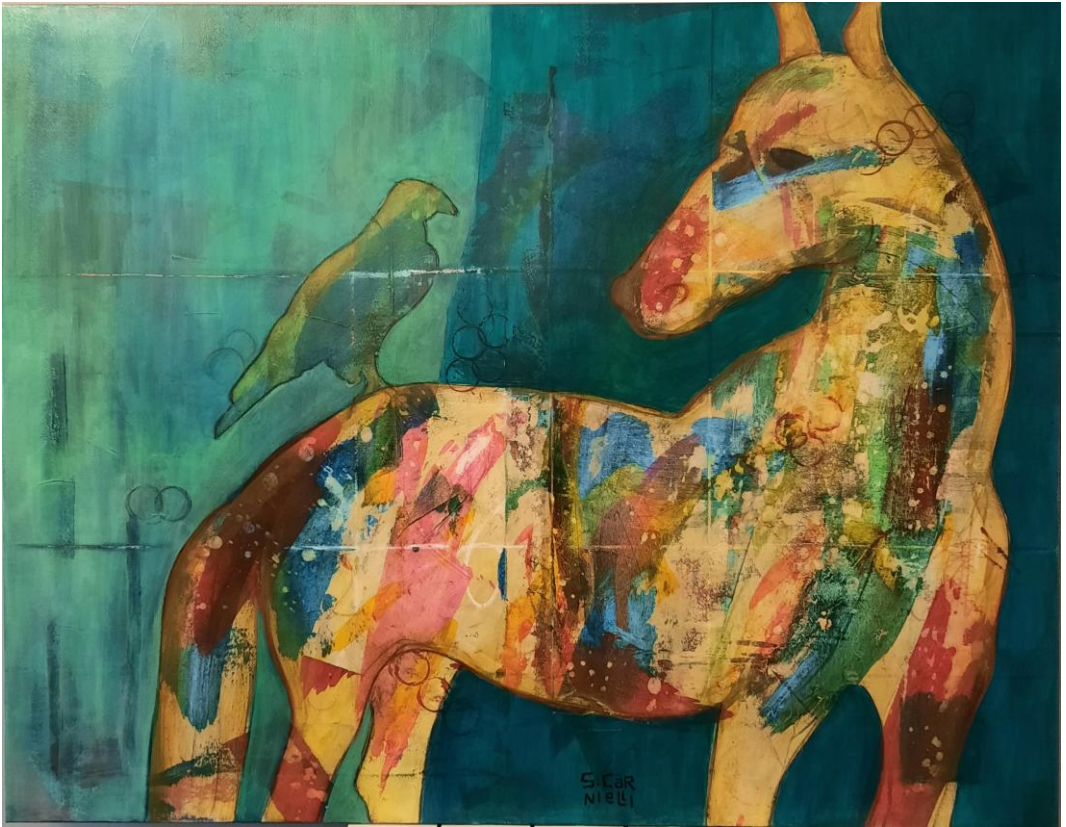
Never alone 90x80 cm Acrilico su tela

Artista interprete di un linguaggio ibrido, sintesi di espressioni astratte e brani di figurativo creato con l'uso indefinito del colore dato a macchie e per sovrapposizioni. Non a caso la sua pittura è stata definita “sinestetica e poliedrica”, capace di esprimere aspetti molto intimi e personali.